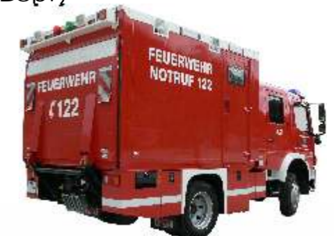
Speziellösung: Empl Kofferaufbau mit Seitentür