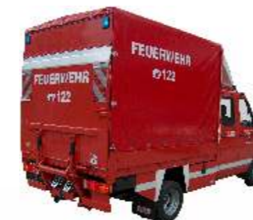
Empl-Spezial-Pritsche mit wasserfestem Siebdruckboden