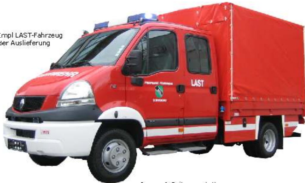
Innen- & Seitenausstattung