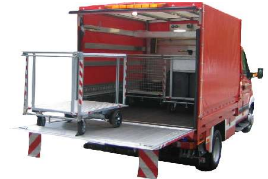
Mögliche Aufbautypen (Bsp.)